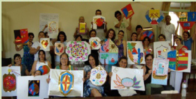
Atividade Artística do Workshop: “O Brasão da Família”. Seminário da Floresta, Juiz de Fora, MG, Março de 2010.